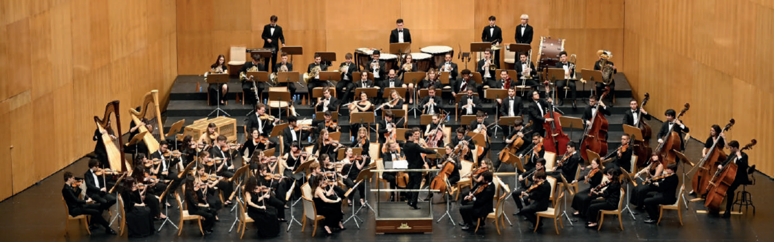
Andrés Orozco-Estrada con la Orquesta Sinfónica Freixenet. Concierto de inauguración del Curso 22-23. Palacio de Festivales de Cantabria, Santander. Noviembre 2022.